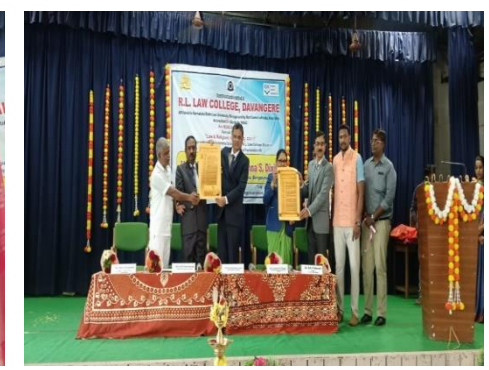
Inauguration of the Program and Inauguration of Scholarship Schemes for R. L. Law college students"