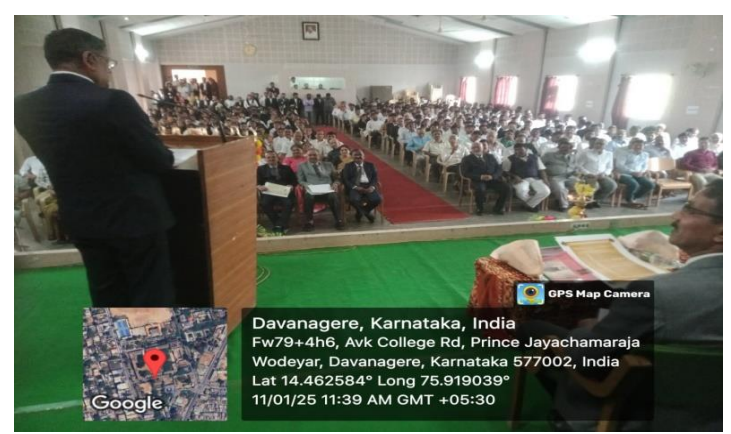
Inaugural Speech by the Hon'ble Justice Krishna. S. Dixit, High Court Of Karnataka