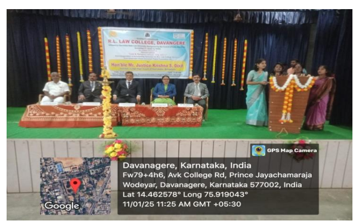
Invocation song by Students