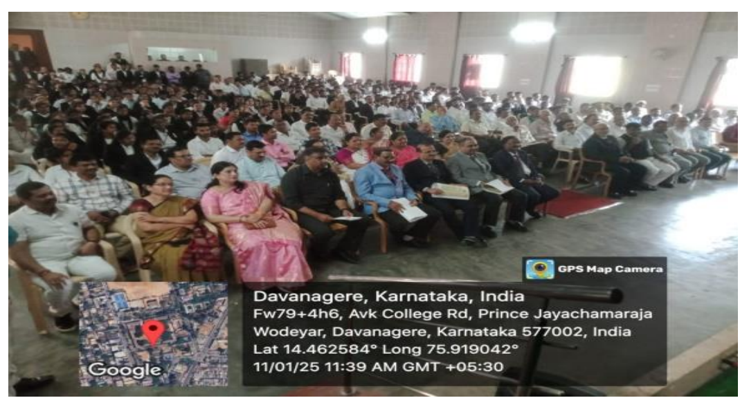
Students and other audience presence in the programme